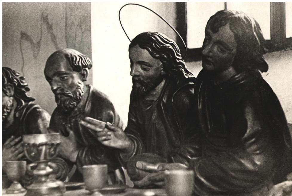
Původní sochy v kapli Poslední večeře, foto před r. 1940

Velikonoce, které jsou těmi největšími svátky celého roku, oslavíme letos opět s modlitbami paši-