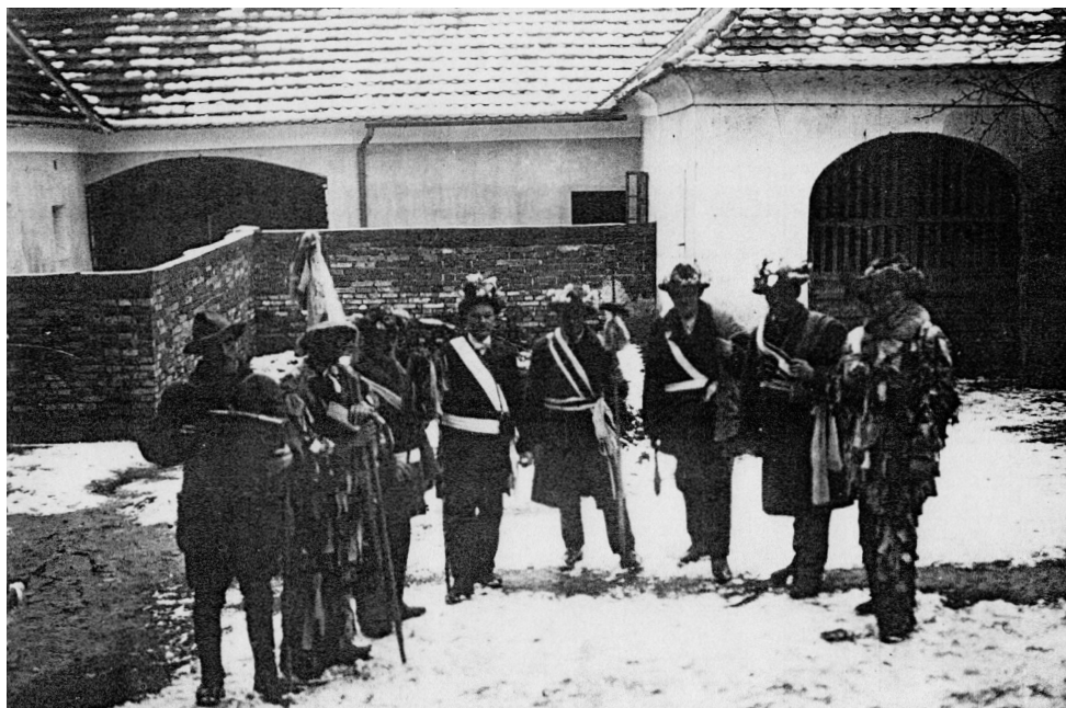
Koledníci na farním dvoře v Římově (někdy mezi lety 1935–1940)

vždy na třetí neděli předpostní, která předchází Popeleční středě: „Kdybych lásky neměl, jsem jako znějící kov a cimbál zvučící.“ (1 Kor 13,1) Jako by ta rozpustilost, patřící k masopustu, v jakémsi bohoslužebném divadle dokreslovala, že všechna radost tohoto světa je bez opravdové lásky a oběti jen onen zvučící cimbál.